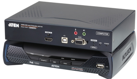
KE8952R /KE8952T (フロント)