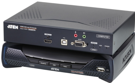
KE8950R /KE8950T (フロント)