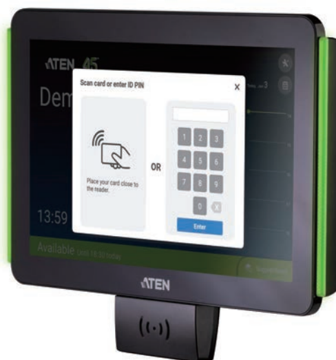
VK430 + VK401