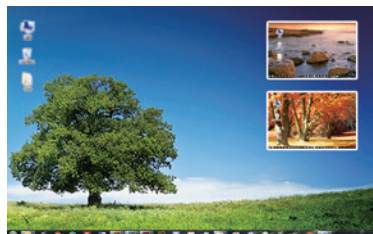
図3:ピクチャ・イン・ピクチャモード トリプル