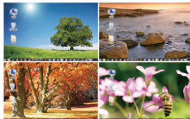
図1:クワッドビューモード コンピューター4台のビデオ出力を一面に表示