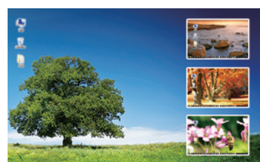
図4:ピクチャ・イン・ピクチャモード クワッド