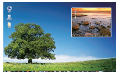
図2:ピクチャ・イン・ピクチャモード デュアル