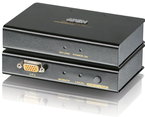
CE250AR (Remote unit)