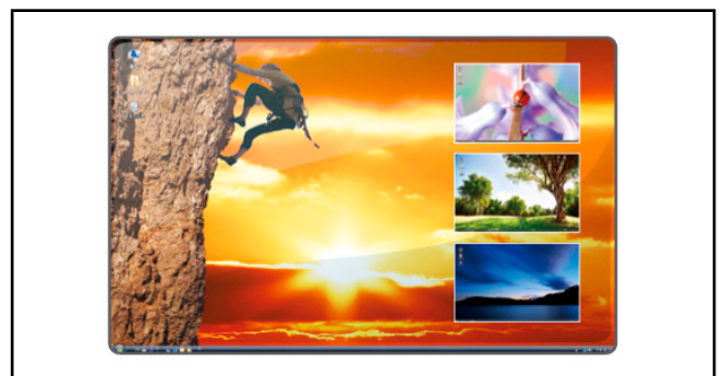
● ピクチャ・イン・ピクチャモード