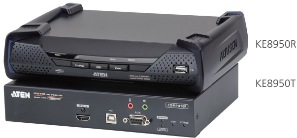
KE8950R / KE8950T 前視圖