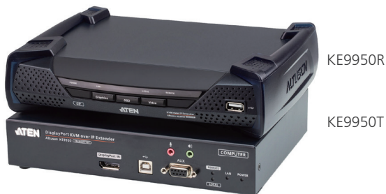
KE9950R / KE9950T 前視圖