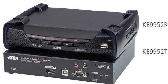
KE9952R / KE9952T 前視圖