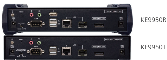
KE9950R / KE9950T 後視圖