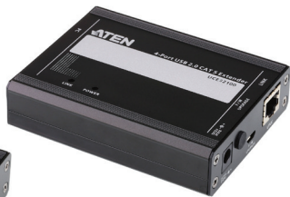
UCE32100 近端裝置 (Tx)